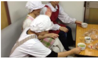
提携先のパン職人さんたち(休憩中)