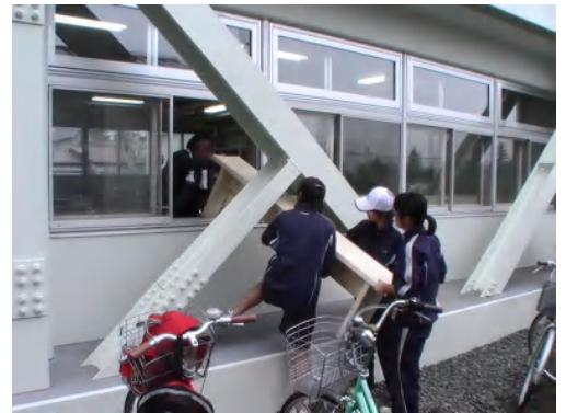
サポーターの方が木工室でベンチを作り、翔陽中テニス部にプレゼント。

市民活動プラザがオープンして、すでに1か月以上経過しました。大勢の方が詰めかけるというほどではありませんが、毎日のように見学の方がおいでになり、六中のコンセプトである「お互いさま」「支え合い」のキモチが、地域のご縁をつなぎ始めています。5月3～6日は、旧六中OB・OGや地域の有志によって前庭（六中の杜）の整備が行われ、木製ベンチも3台製作・寄贈されました。